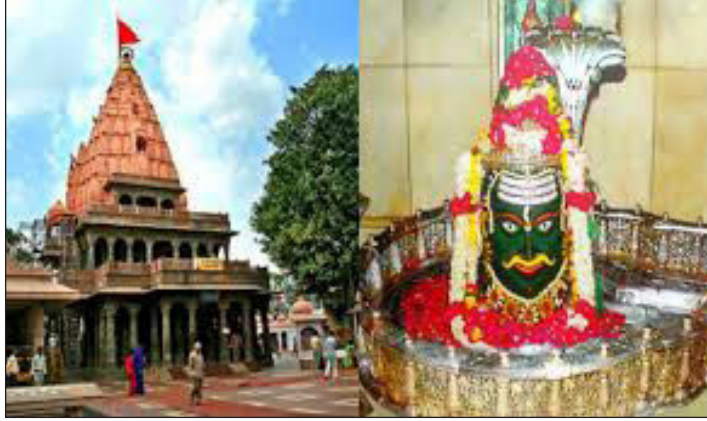
के महाकालेश्वर मंदिर तीन हिस्सों में विभाजित है। इसके ऊपरी हिस्से में नाग

देश-विदेश से आते हैं दूरिस्ट महाकाल मंदिर में - भगवान शिव के 12 ज्योतिर्लिंगों में से एक उज्जैन